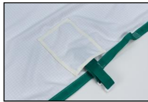
Schnallen in Taschen