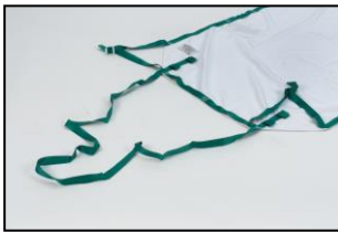
Extra lange Zugbänder