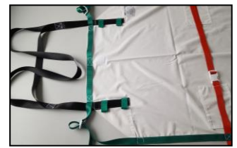
Optional: Bänder in 3 Farben